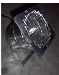
PAR 56 CHROME COURT