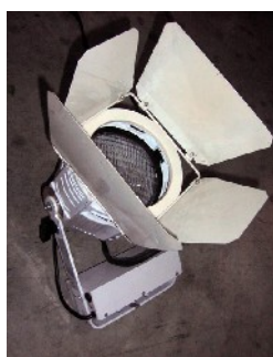
OPTIC PAR 150 CDM