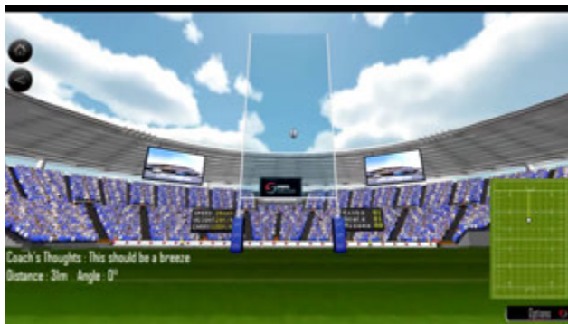
Rugby à 7