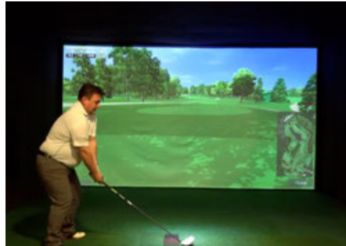
Simulateur de Golf