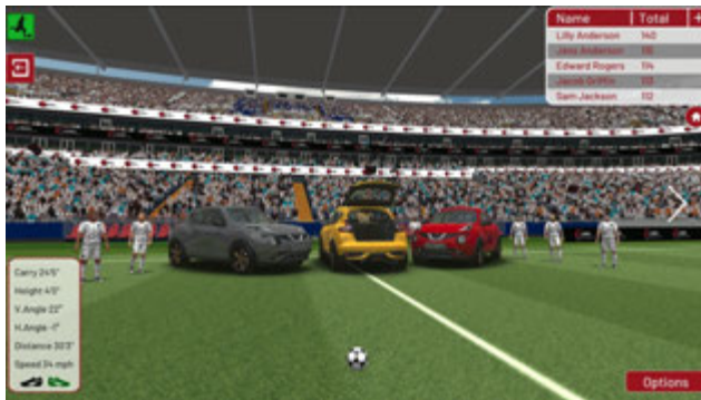
Jeux en challenge dans l'univers automobile