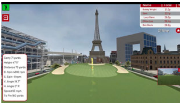
Nombreux monuments de ville numérisés comme terrain de jeu : Paris, Londres, New York, Dubai...