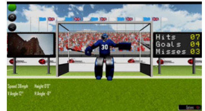
Hockey sur herbe