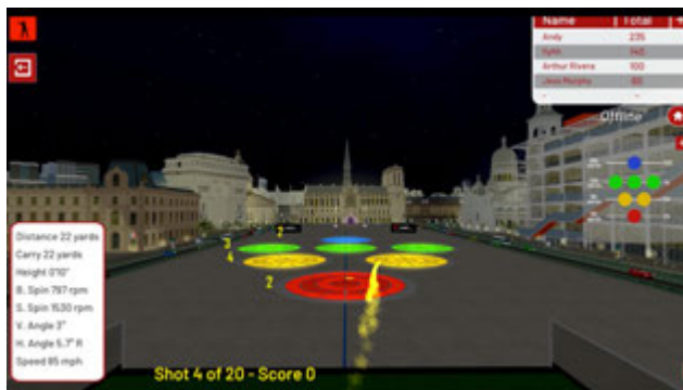
Contest Golf (ludique)