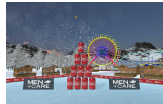
Nombreux décors thématiques: Noël, Halloween...