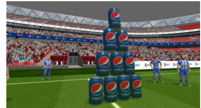
Jeux en challenge dans l'univers des boissons