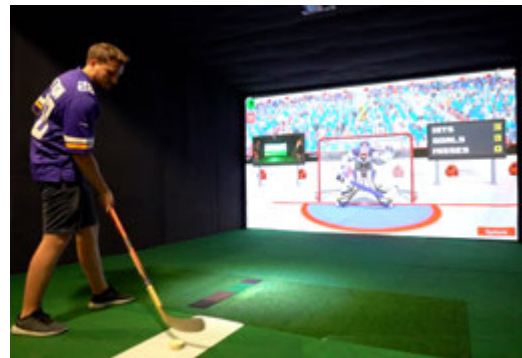
Hockey sur glace