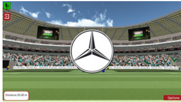
Jeux autour de cibles en logo