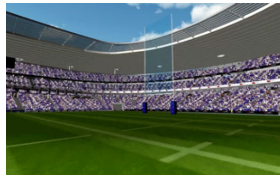
+1 500 stades disponibles