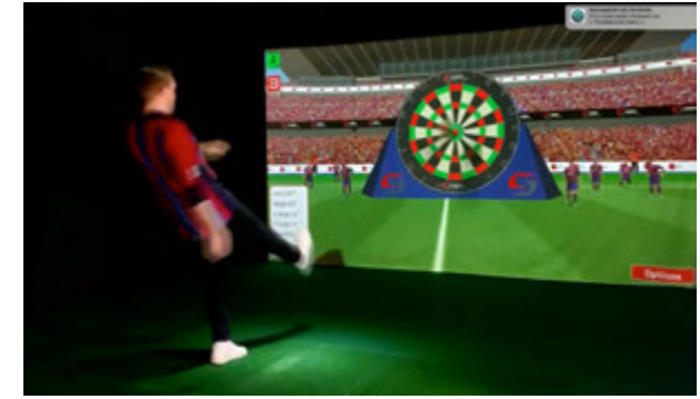
Déclinaisons ludiques avec +100 jeux