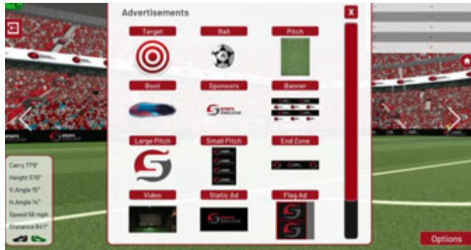
Interface entièrement personnalisable