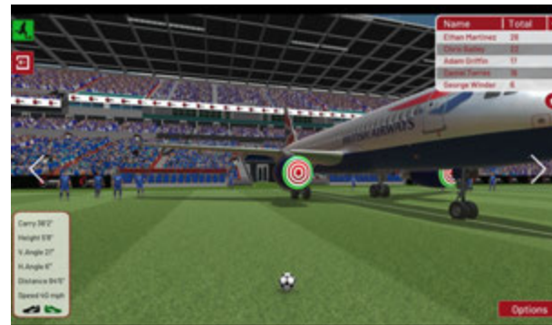
Jeux en challenge dans l'univers aéronautique