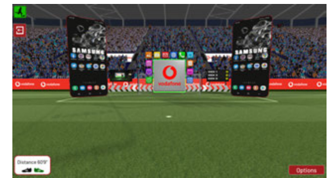
Jeux en challenge dans l'univers des télécoms