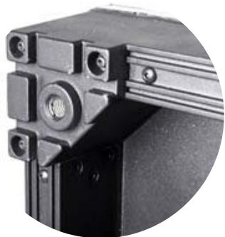
DÉTAIL DU PROFILÉ