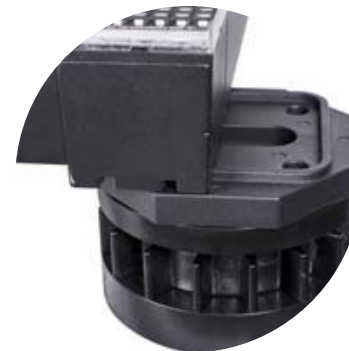
ACCESSOIRES POSE AU SOL